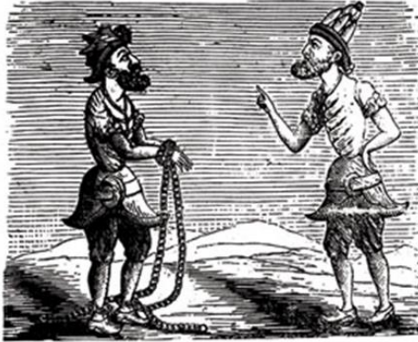
- Nedir bu hal Karagöz? - Kanun dairesinde serbesti, Hacıvat!

Hayal, Tanzimat döneminde aslen karikatür nedeniyle kapatılan ve her sayısında mutlaka karikatür yer alan bir diğer dergidir. Hayal de Diyojen gibi Teodor Kasap tarafından çıkarılır ve iki karikatür derginin kapanmasına ve sahibinin hapis cezasında mahkûm olmasına neden olur.